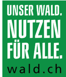
Logo der Imagekampagne für den Schweizer Wald und die Schweizer Forstbranche.

Trotzdem ist festzustellen, dass die moderne Gesellschaft die Pflege und Bewirtschaftung des Waldes immer weniger als eine Selbstverständlichkeit hinnimmt und auf entsprechende Arbeiten oftmals kritisch reagiert. Häufig wird der direkte Zusammenhang zwischen der Bereitstellung der Produkte des Waldes, namentlich der Holzproduktion, und der Waldbewirtschaftung nicht verstanden. Die vielen für Natur und Umwelt positiven Effekte der Waldnutzung sind für Laien nicht ohne weiteres erkennbar.