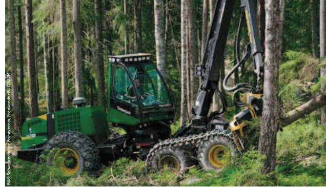
Ohne moderne Ernteverfahren wäre die Holznutzung in vielen Regionen unrentabel.

Eine der dringenden Fragen lautet demnach: Wie können wir den Wald stärker nutzen, damit die hohen Vorräte abnehmen und seine Altersstruktur ausgeglichen wird? Denn «mehr» bedeutet