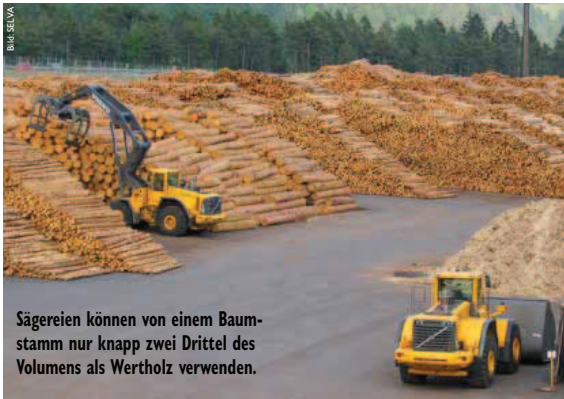
Sägereien können von einem Baumstamm nur knapp zwei Drittel des Volumens als Wertholz verwenden.

holz verarbeitet wird – und Industrieholz. Letzteres bildet den Rohstoff für eine spezialisierte Industrie. Es wird mechanisch zerkleinert oder chemisch in seine Bestandteile zerlegt und zu unzähligen Produkten und Werkstoffen verarbeitet, von denen keiner mehr ahnen würde, dass sie zumindest teilweise aus dem Wald stammen.