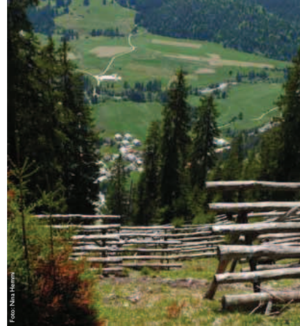
Mehr als ein Drittel des Waldes dient dem Schutz vor Naturgefahren – allerdings sind manchmal technische Massnahmen zur Unterstützung unumgänglich.

Frägt man, was die Menschen hierzulande im Wald suchen, so wird vor allem die Erholung genannt. Die Möglichkeiten dazu sind (beinahe) grenzenlos, denn der Wald ist frei zugänglich, auch wenn er in privater Hand ist. 71% des Waldes gehören politischen Gemeinden, Bürgergemeinden