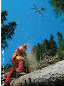
Durchschnittlich werden jährlich zwischen 4,5 und 5 Mio. m³ Holz genutzt.

kunft – erfüllen kann (SOLL-Zustand). Natürlich können die drei Aspekte je nach Standort lokal unterschiedlich gewichtet werden, ohne dass damit das Prinzip der Nachhaltigkeit verletzt wird. Regional sollte das Gleichgewicht über die drei Dimensionen aber gewährleistet sein.